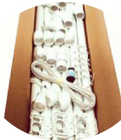
kit d'installation 3 prises

la centrale ALPHASPI un véritable concentré de technologie