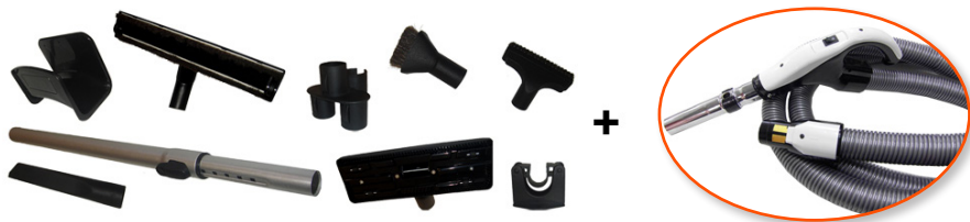
CARACTERISTIQUES TECHNIQUES « AA 350 »